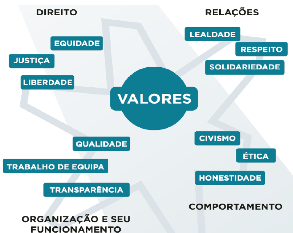
Figura 2 – Valores